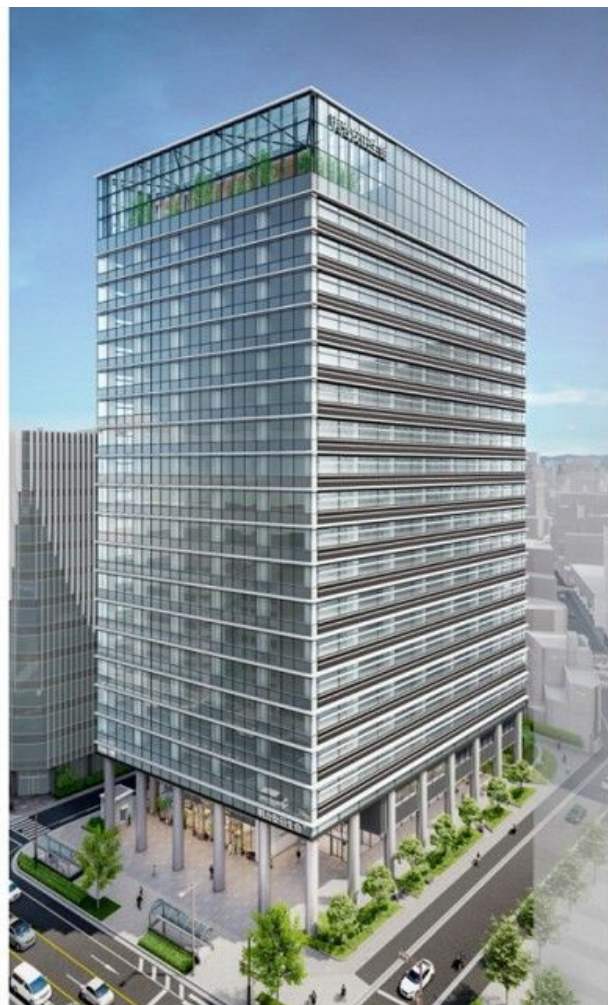
オフィスフロア (基準階: 3階~19階)