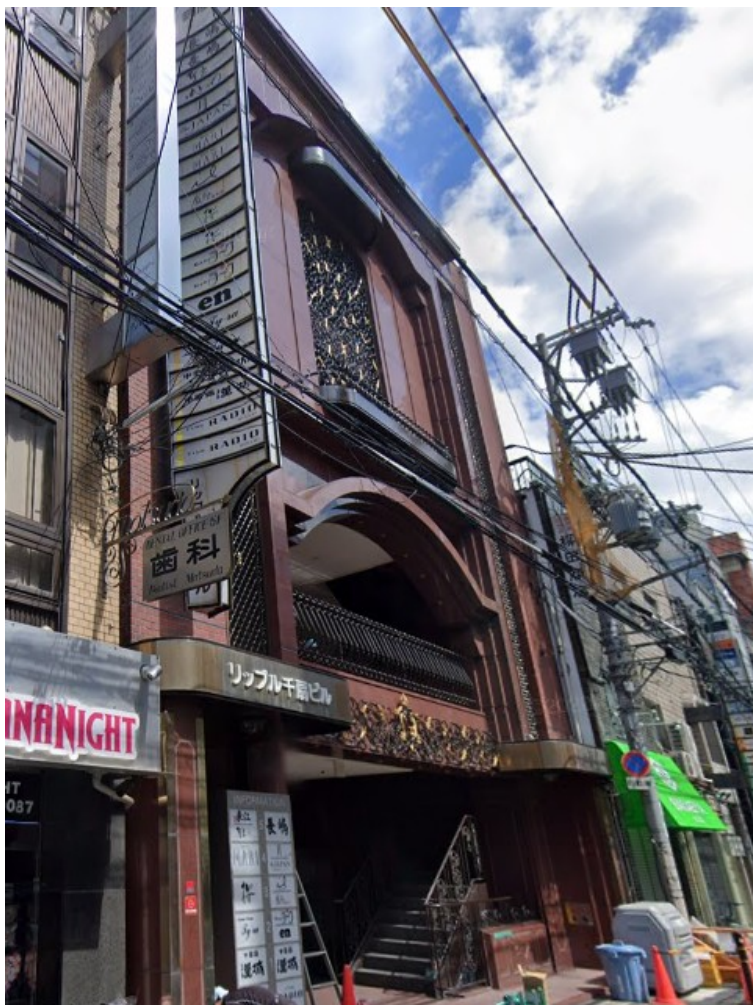
リップル千扇ビル 1AB 38坪