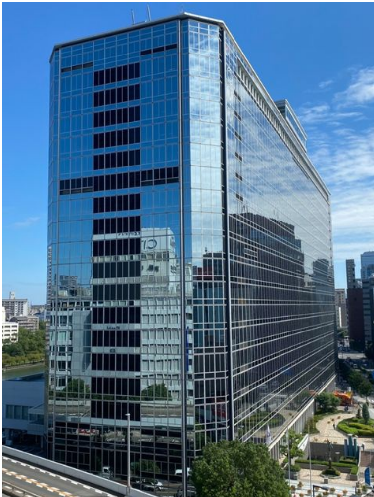
1 F (西側)