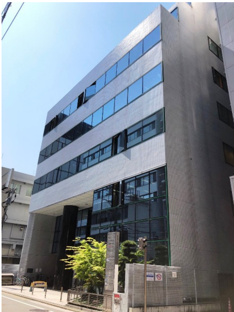
《 8階フロア 》