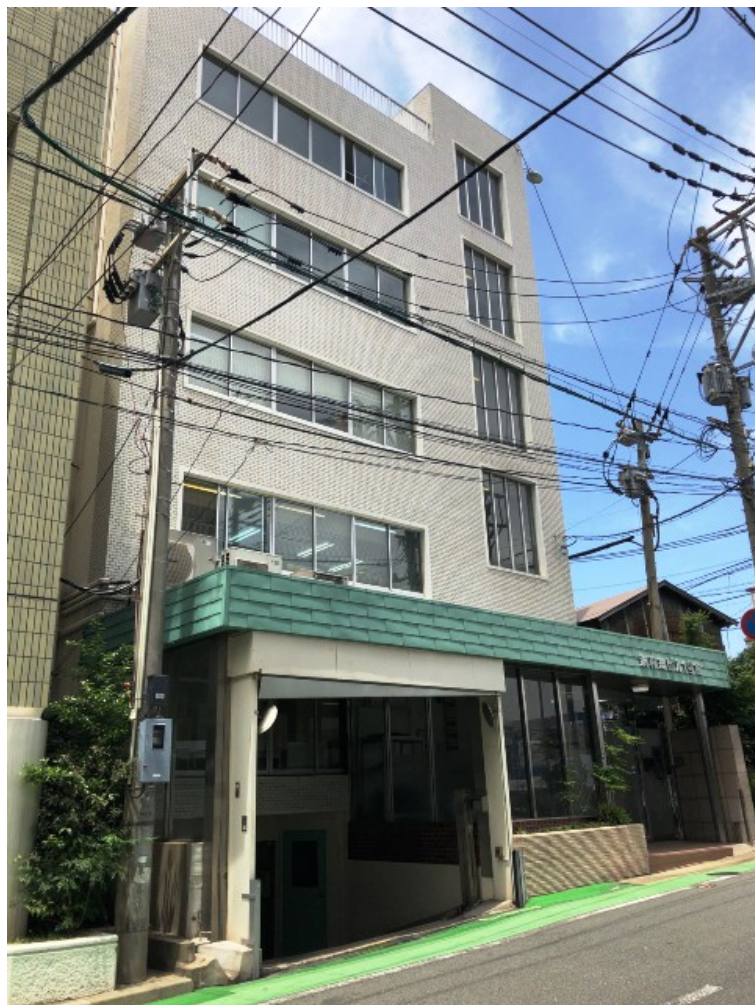
新幹線ビル1号館 502階 14.50坪