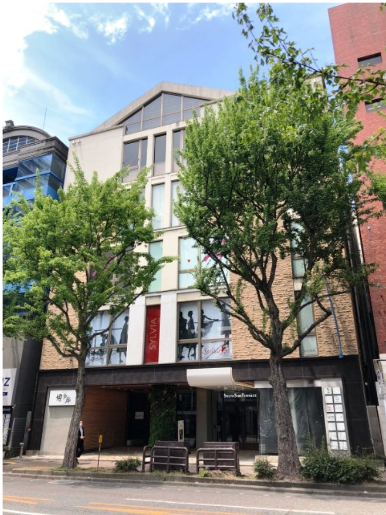
5F 分割プラン ※賃貸面積に若干変更がある場合があります