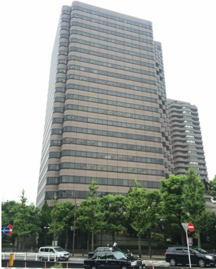
【2階】 東京マリオットホテル内区画