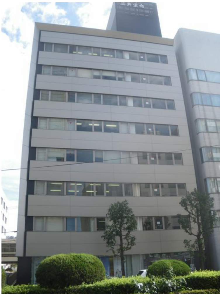
長崎ビル 6階 105.28㎡(31.84坪)