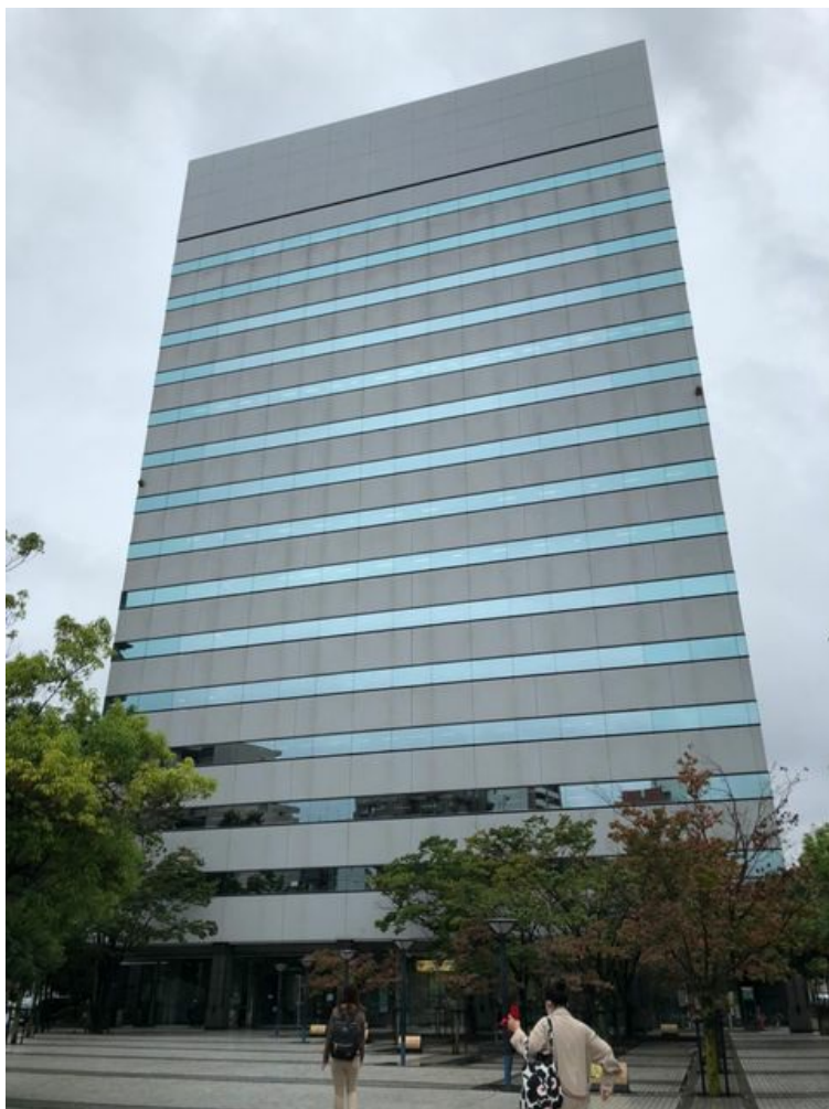
(東側)地上13・14階 空室区画図面