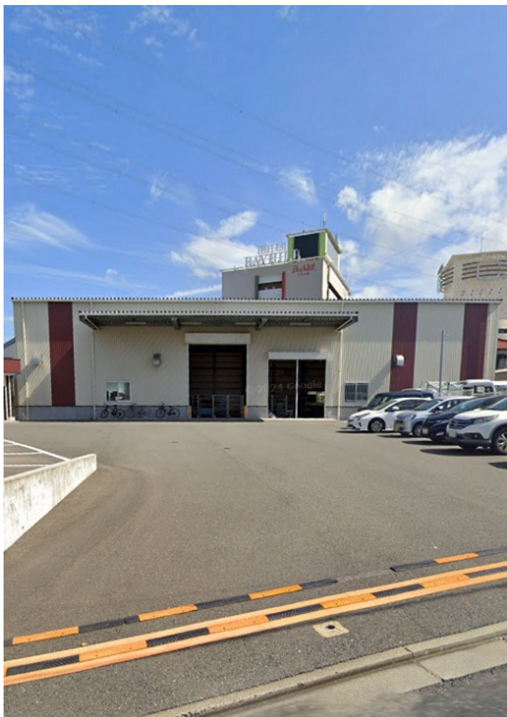
オフィスストレージ小倉東インターI B棟