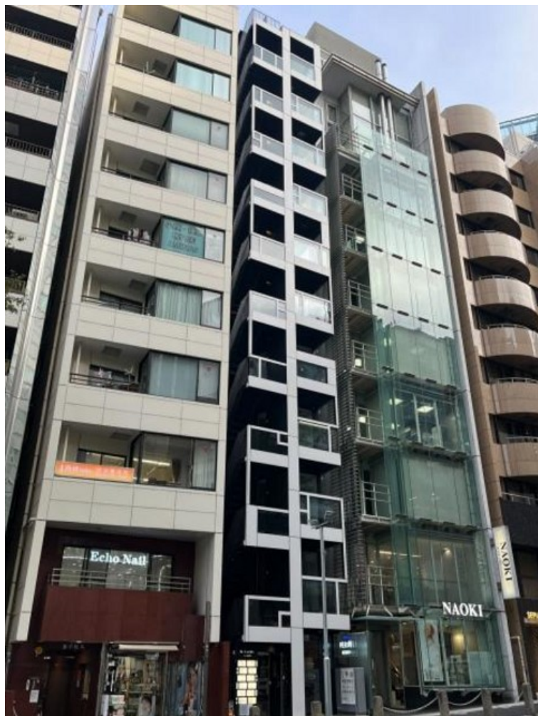
6・8階 (会議室奥側プラン)