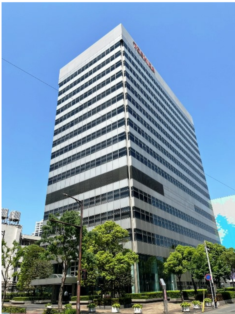
募集区画 1階一区画: 82.12 m 2 (24.84 坪)